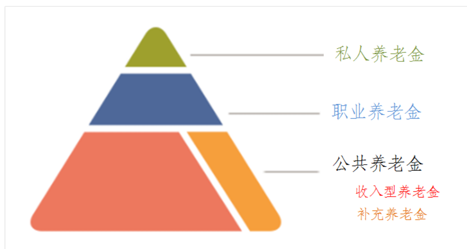
图表 2 瑞典养老金金字塔结构

经过多年发展，瑞典已经形成以第一支柱为基础、第二支柱有力支撑、第三支柱顶层补充的养老金“金字塔”结构。根据养老金管理局 2015 年数据，养老金资产规模总计 4630 亿克朗，其中公共养老金 2840 亿克朗，占比 61%，职业养老金 1700 亿克朗，占比 37%，私人养老金 90 亿克朗，占比 2%（图表 2）。